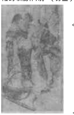
（国画） 考 保 险 韩绍先

市保险公司重视新闻报道工作，从7月19日开始，对本市保险职工撰写的稿件给予奖励。具体标准为：一、国家级新闻单位刊播的奖励稿酬的300%；二、省级新闻单位刊播的奖励稿酬的200%；三、市级新闻单位刊播的奖励稿酬的100%；四、县、区级新闻单位刊播的奖励稿酬的50%。（绍先）