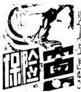
东营市 报 公 司 合 办

机动车辆保险 近年来，有些保户在将自己的机动车辆转卖时，事先不到保险公司办理过户手续，等到新买车的车主在使用未过户的车辆发生肇事后，才到保险公司报案索赔，并要求办理过户手续，根据规定保险公司对这种情况不能承担赔偿责任，所以，车辆转卖千万不要忘记办理保险过户手续。（李树春）